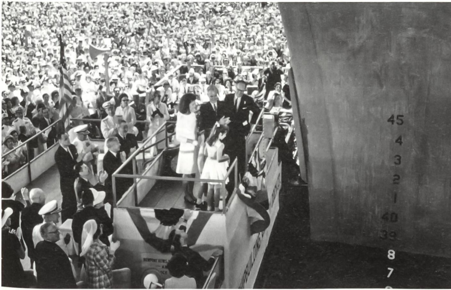
Die Tochter des verstorbenen Präsidenten, Caroline Kennedy, taufte am 27. Mai 1967 den Flugzeugträger auf den Namen USS John F. Kennedy.

schen Golf verschieben musste und der Kommandant deswegen seines Kommandos enthoben wurde.