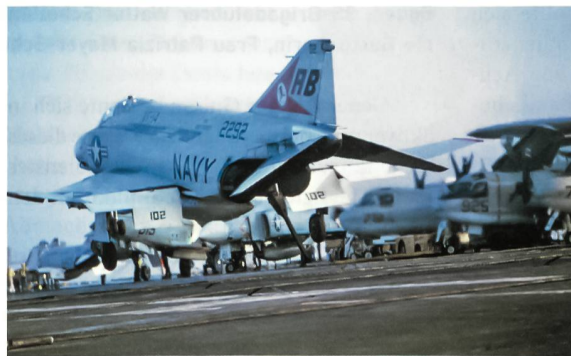
Eine F-4B Phantom II der Fighter Squadron VF-14 («Top-hatters») landet auf dem Flugdeck der USS John F. Kennedy (CV 67) unterwegs im Ionischen Meer.

Nach der stundenlangen anstrengenden Versorgungsoperation fuhr der Verband zur Hurd-Bank, einer Stelle des Mittelmeeres mit geringer Tiefe in der Nähe von Malta, wo er vor Anker ging. Dann konnte sich die Besatzung beim Sport auf dem Flugdeck, mit