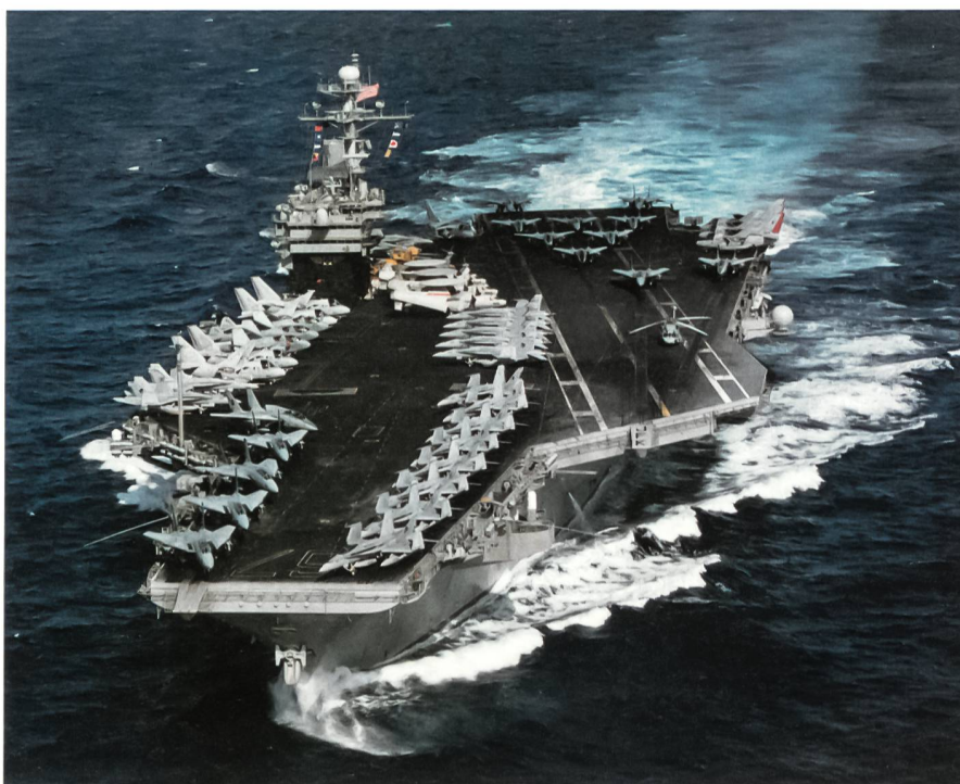
Eine Aufnahme der «Big John» aus dem Jahre 1997.

Der Flugzeugträger wurde auf den Namen des legendären 35. Präsidenten der USA getauft. Nur elf Monate nach der Ermordung von John F. Kennedy (JFK) am 22. November 1963 in Dallas, Texas, war die Kiellegung erfolgt, und am 27. Mai 1967 taufte Caroline, die kleine Tochter von JFK, das Schiff auf den Namen ihres Vaters. Am