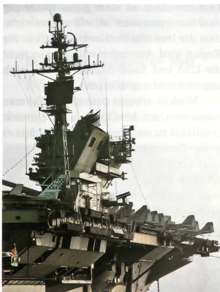
Vor dem Hafen von Barcelona liegt die CV 67 vor Anker.

Zu den unerfreulichen Ereignissen gehörten 1975 die nächtliche Kollision vor Sizilien mit dem Raketenkreuzer USS Belknap, wobei dieser schwer beschädigt wurde; die Reparaturarbeiten dauerten vier Jahre. Unrühmlich war auch, als im Jahr 2001 das Schiff wegen mangelhaften Unterhalts eine geplante Verlegung in den Persi-