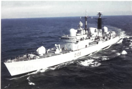
Zerstörer des Typs 42.

Betroffen sind zwei Zerstörer des Typs 42, alle vier Fregatten des Typs 22