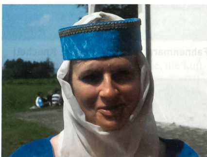
Hofdame aus dem deutschen Hachberg.