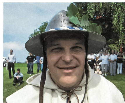
Von der Luzerner Zunft zu Safran.