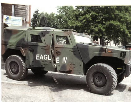
Der moderne Eagle IV.