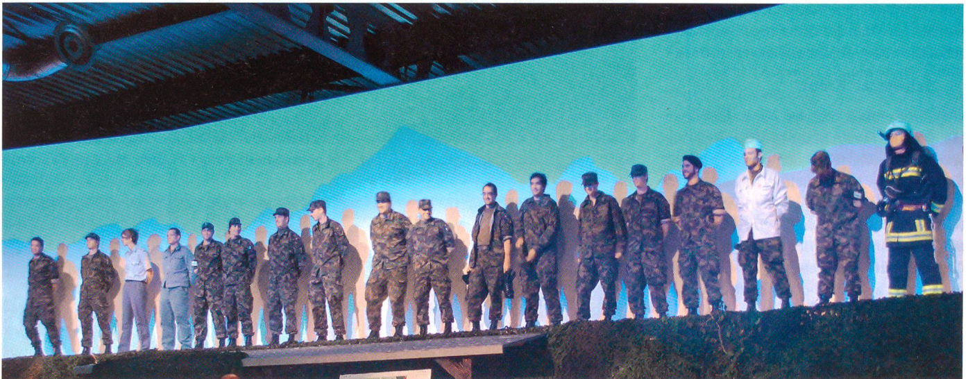
Mehrere zehntausend Gäste besuchten die Comm'08 – das Programm stiess auf lebhaftes Interesse.