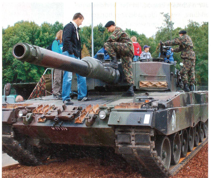
Früh übt sich auch auf dem Leopard.