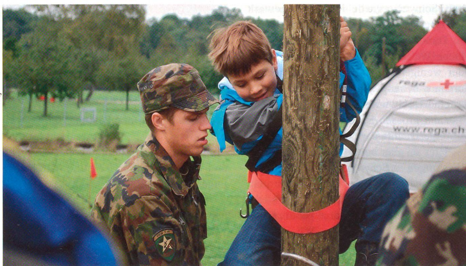
Jung und ganz Jung an der Comm'08 auf dem Waffenplatz Frauenfeld.

Bei Grossanlässen und Katastrophen dient der Einsatz der Führungsunterstützungstruppen der Armee zur Entlastung der zivilen Behörden. Das Betreiben von Führungsanlagen, der Aufbau von krisen-