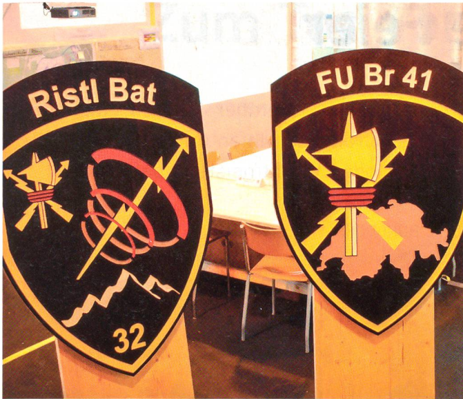
Richtstrahlbataillon 32 und FU Brigade 41.