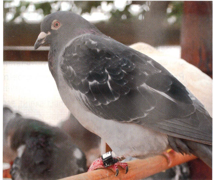
Brieftauben als Verbindungsmittel.