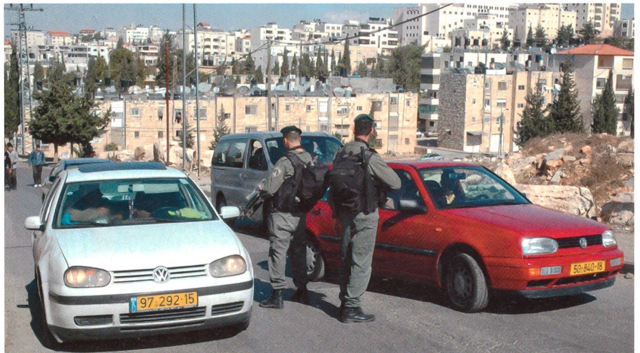
Strassenkontrolle auf Schleichwegen. Die Beamten der Special Patrol Unit sind auf der Suche nach gestohlenen Fahrzeugen, die wegen den unauffälligen israelischen Nummernschildern und Fahrzeugtypen gerne für Autobomben und Drogenkurierfahrten genutzt werden.

tungsstandards sind. Auch werden laufend psychologische Tests abgefordert. Bei einer Patrouille in der Altstadt konnten sogar eigene Erkenntnisse und Eindrücke gewonnen werden. Jedoch sind die Händler und Bewohner der Gassen natürlich nicht das Ziel dieser Aktion, sondern zwielichtige Gestalten, die die Polizisten nur anhand der Kleidung, des Dialektes und der Verhaltensweise sofort selektieren und Fremde unmittelbar stoppen.