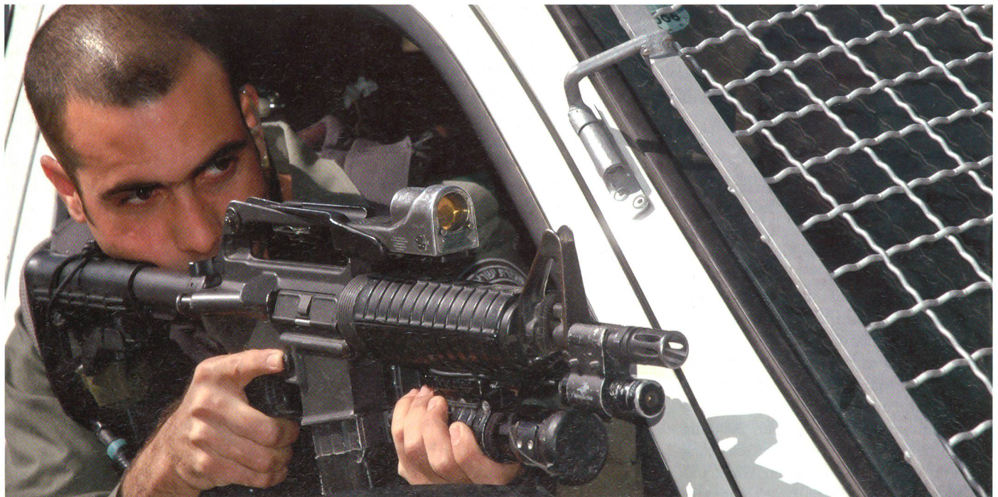
Nahsicherung während andere Kollegen einen Check-Point einrichten. Auf dem Colt Commando sitzt ein Trijicon ACOG Reflexvisier und ein Laser-Pointer von Winchester.

Das Hauptziel sind Kriminelle, die im terroristischen Milieu tätig sind und wirkliche Terroristen, die versuchen über Jerusalem das Kernland zu infiltrieren. Nebenbei ist die Einheit im Erkennen von gefälschten Papieren besonders geschult. Das präventive Erkennen und Identifizieren von verdächtigen Personen durch einfache optische Hinweise ist eine weitere Besonderheit der Einheit. Die Tätigkeit der Männer und Frauen erstreckt sich über die bereits genannten Sektoren und insbesondere auf die empfindlichen Punkte der Stadt, die sogenannten Sensitive Sites. Diese umfassen wesentliche jüdische, christliche und arabische Kulturbauten, öffentliche Plätze und Einrichtungen, Behörden und natürlich die Klagemauer, einer der heiligsten Plätze der