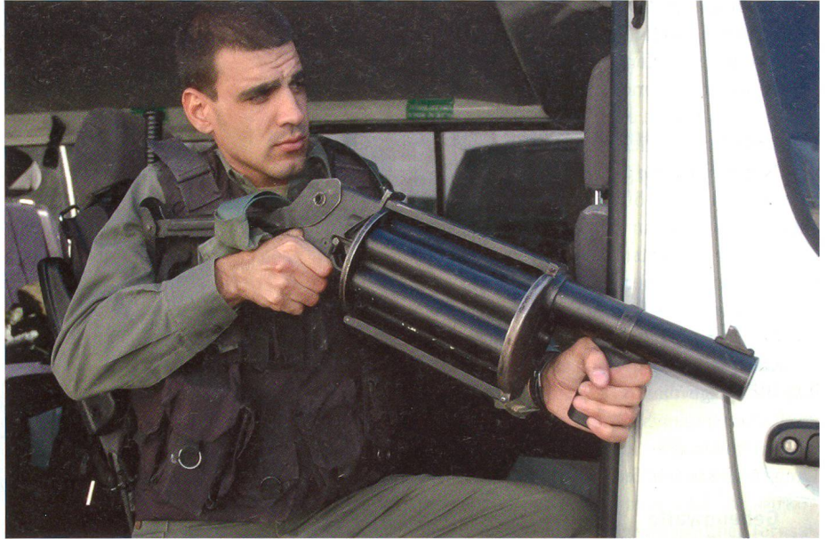
Mit dem Multi-6 Shot Launcher in 37/38 mm von Combined Tactical Systems lassen sich nicht nur Unruhen beenden, sondern man kann auch seine Kollegen der Special Patrol Unit damit wirkungsvoll decken.

Damit keiner zu bequem wird, wenn er es bis in die Special Patrol Unit geschafft hat, werden alle drei Monate fordernde Sporttests und Schiessübungen durchgeführt um zu sehen, wie die aktuellen Leis-