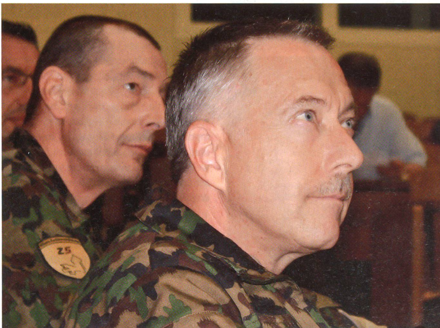
Brigadier Rolf Oehri und Divisionär André Blattmann.

Die Führungsausbildung der Armee im Massstab 1:1 erleben und ihren Mehrwert für die Wirtschaft erkennen: Unter dieser Zielsetzung trafen sich in Luzern rund 20 Exponenten von Schweizer Dach- und Fachverbänden der Wirtschaft mit hochrangigen Armeevertretern. Sie besuchten an der Höheren Kaderausbildung der Armee (HKA) einen Lehrgang angehender Mitarbeiter in Bataillons- und Abteilungsstäben. Der Anlass ist eine Massnahme der Armeeführung zur Intensivierung des Dialogs der Armee mit wichtigen Ansprechgruppen aus der Schweizer Gesellschaft.