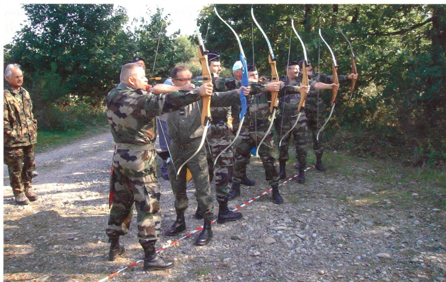
Mitglieder des UORR Mulhouse beim Bogenschiessen.

Inzwischen war der Uhrzeiger gegen 18 Uhr vorgerückt. Für uns hiess dies zurück ins «Ball-Trap-Zentrum» wo um 18.30 Uhr die Rangverkündigung mit anschlies-