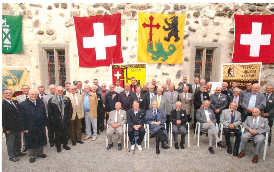
Die Festgemeinde vor ihren Fahnen.