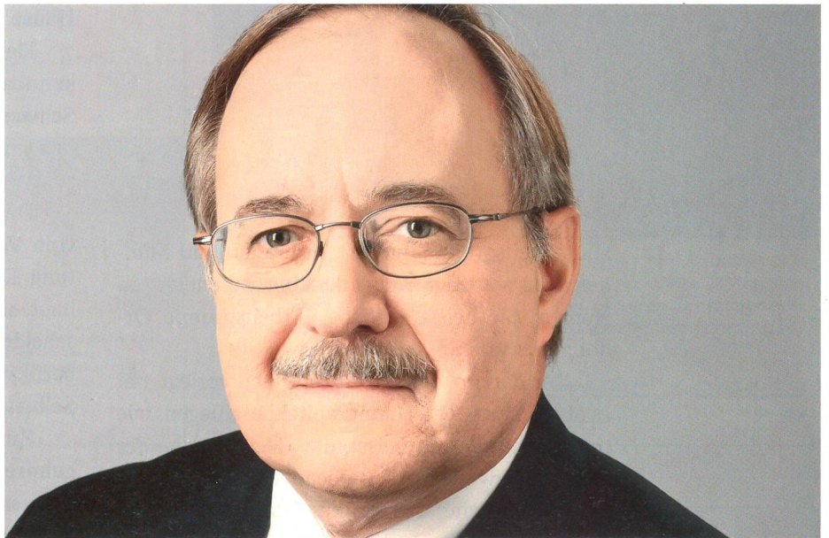
Am 31. Dezember 2008 verlässt Samuel Schmid den Bundesrat und das VBS.

1972 wurde er als 25-jähriger Gemeinderat von Rüti bei Büren, zwei Jahre später Gemeindepräsident. Von 1982 bis 1993 ge-