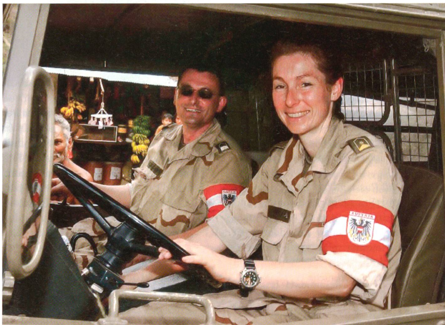
Gut gelaunt am Steuer.

weibliche Offiziere als Truppenoffiziere verwendet. Neun Berufsoffiziersanwärterinnen besuchten den Fachhochschul-Diplomstudienlehrgang «Militärische Füh-