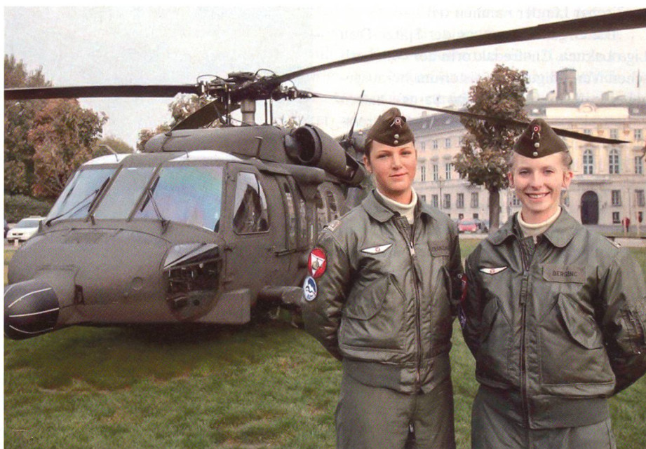
Mit grossem Können und Wissen im Helikopter-Einsatz.

Im Jahr 1996 einigten sich die damaligen Regierungsparteien über die Öffnung des Bundesheeres für Frauen. Das Koalitionsübereinkommen sah vor, den Frauen gleichberechtigte Möglichkeiten von Berufskarrieren – auf freiwilliger Basis – beim ÖBH zu eröffnen. Am 3. April 1997 nahm der Ministerrat einen Bericht der Bundesministerien für Landesverteidigung und für Frauenangelegenheiten betreffend die