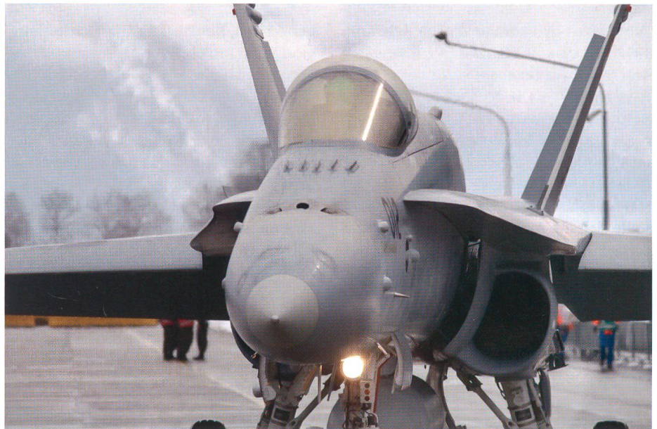
Jets müssen fliegen können - auch in den Alpen.

Die Einsätze werden ab unseren Hauptstützpunkten, Meiringen, Sion und Payerne geflogen, alle diese air bases befinden sich in touristisch nutzbaren Regionen. Es ist auch in unserem Lande so, dass unsere Piloten dort trainieren und operieren müssen, wo sie in einem effektiven Ernstfall auch zum Einsatz kommen würden. Mit einer Bejahung dieser haltlosen Initiative käme dies einem Grounding unserer Luftwaffe gleich.