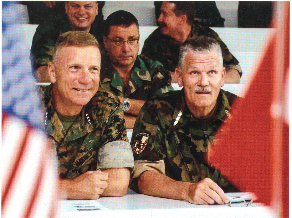
Der Chef der Armee empfängt den Kommandanten des U.S. Marine Corps, General Hagee, zu einem Kurzbesuch in Walenstadt.

Wer Keckeis näher kennen lernen konnte, sei es als Referent in einer OG oder einem UOV, als Debattierer, bei Truppenbesuchen, als Chef im kleinen persönlichen Stab, in der persönlichen Begegnung als Mensch oder auf Reisen, hat diesen Chef der Armee ganz anders empfunden, als er durch viele Medien, Politiker oder Dritte verzerrt dargestellt wurde. Wer seine Offenheit und Natürlichkeit erleben durfte, stellt fest, dass es sich bei Korpskommandant Keckeis um einen höchst integren, grundkorrekten und fairen Menschen handelt, der diskret auch Emotionen zeigen kann.