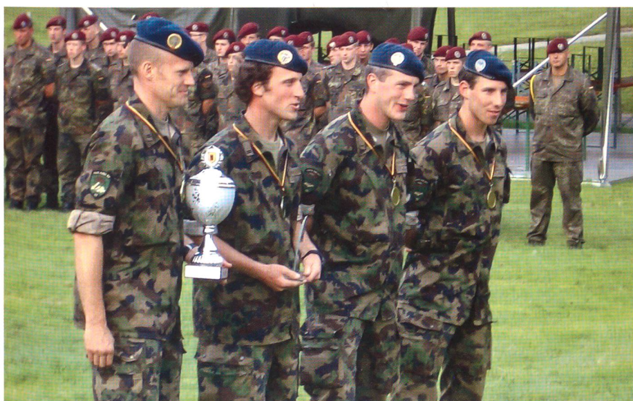
Das siegreiche 17-er-Team, alle Miliz.