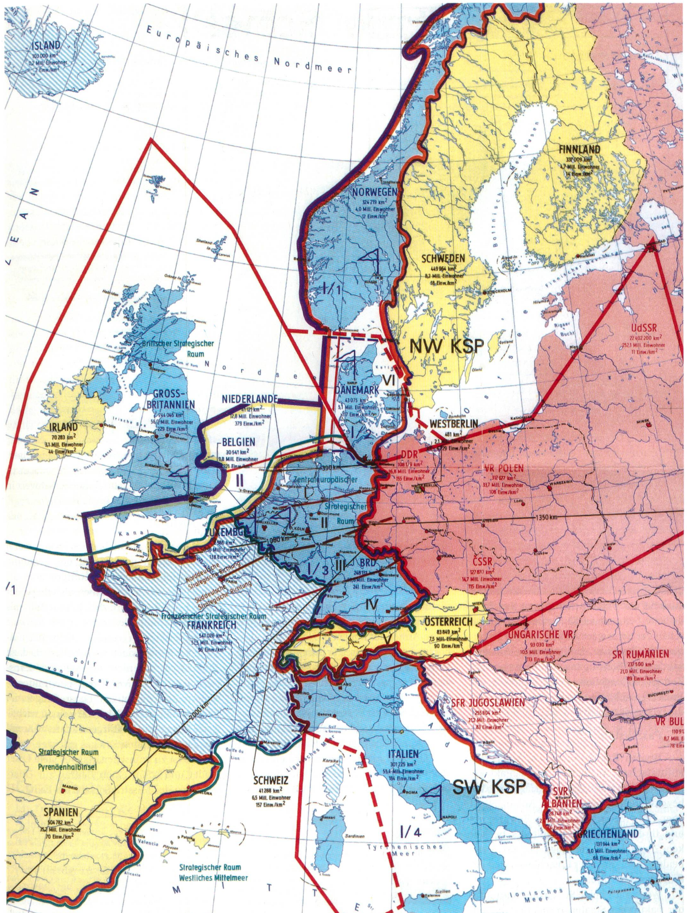
Übersichtskarte aus dem Militärgeschichtlichen Atlas der NVA (1981).