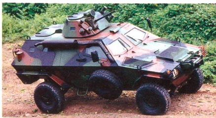
Otokar Cobra (Türkei).

Das Slowenische Verteidigungsministerium bestätigte, dass das ABC-Bataillon bis Ende 2008 10 ABC-Aufklärungsfahrzeuge des Typs Otokar Cobra aus türkischer Fertigung erhalten wird. Die sloweni-