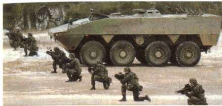
Patria AMV der Slowenischen Streitkräfte bei Demonstration

Das Slowenische Verteidigungsministerium hat am 18. Dezember 2007 den ersten von insgesamt 135 Patria 8x8 AMV (Armoured Modular Vehicle) erhalten. Das Fahrzeug wird nun bis im März durch die Truppe scharfen und intensiven Einführungstests unterzogen. Die slowenische Variante des AMV wurde von