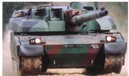
Kampfpanzer Leclerc (Frankreich).

Laut Quellen aus dem Verteidigungsministerium wurde mit dem staatlichen Rüstungshersteller Nexter – vormals GIAT – ein Notfall-Vertrag über die Produktion von Ersatzteilen für die 355 Leclerc-Kampfpanzer sowie 20 Leclerc-Bergepanzer, welche