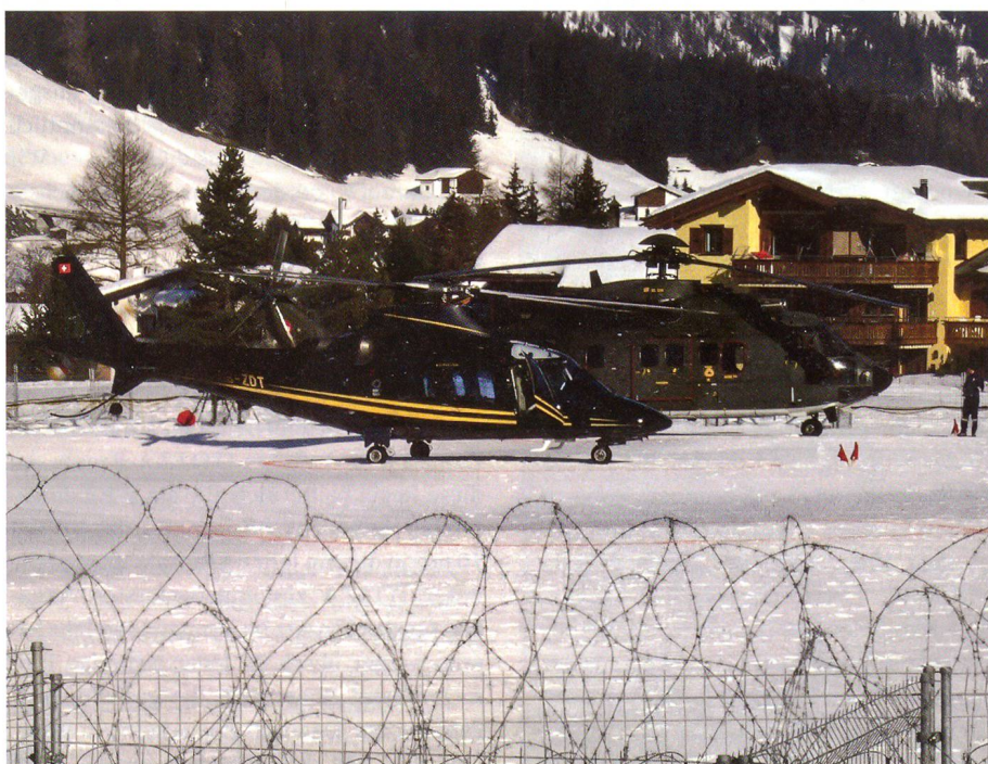
Stilli Mountain Heliport: Zivile und militärische Helis beisammen.