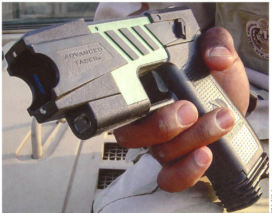
Auch die amerikanische Army verwendet den Taser als nicht tödliche Waffe.

Die eingangs zitierte Parlamentarierin steht mit ihrer Kritik auch sonst nicht allein. Seit Jahren bestürmt Amnesty International bei jeder Gelegenheit die Behörden, sie müssten den Taser verbieten, bis seine Gefährlosigkeit erhärtet sei. Dabei nennt die Organisation gerne den Taser in einem Atemzug mit «Gummigeschossen», dem bei unfriedlichem Ordnungsdienst erprobten, seit Jahren unentbehrlichen und weitge-