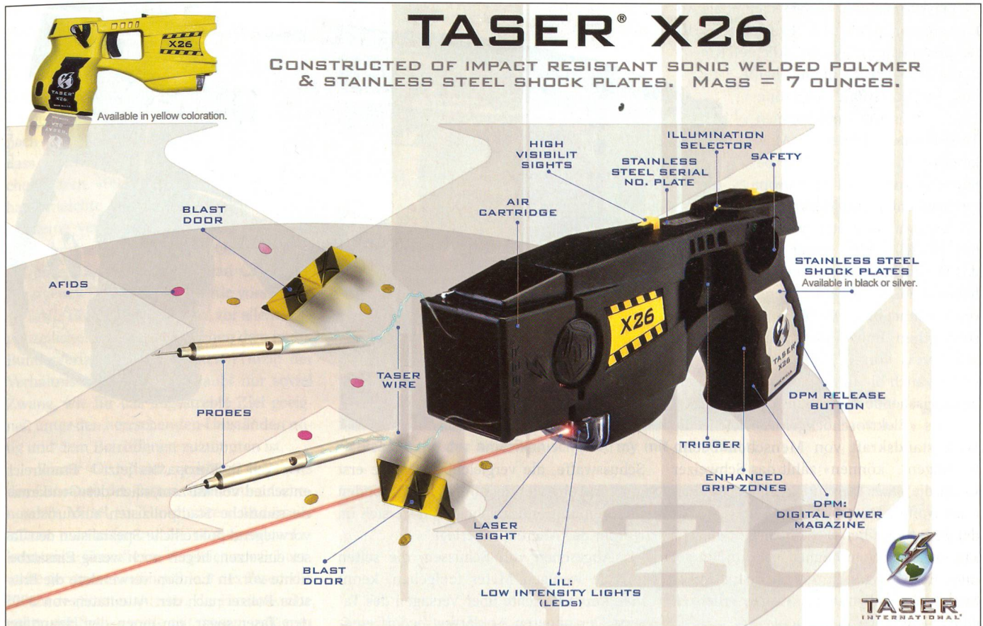
Der technische Aufbau der Version «Taser X26».

hend ungefährlichen Gummischrot. Eine Mehrheit des Gemeinderates der Stadt Zürich suchte mit dem Budget 2007 den Stadtrat an weiteren Taser-Beschaffungen zu hindern.