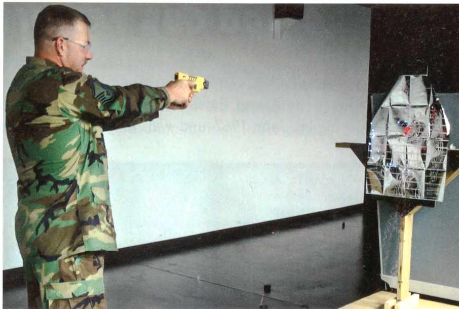
Schiessübung der amerikanischen Army mit dem Taser.

Acht schweizerische Kantone und einzelne grössere Stadtpolizeikorps verwenden den Taser in den polizeilichen Spezialformationen, deren Angehörige zugezogen werden, sobald sich eine schwere Konfron-