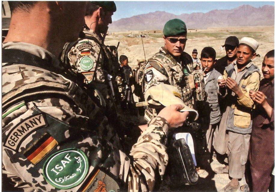
Deutsche Soldaten bei Bagram im Norden Afghanistans.

Den politischen Hintergrund bildet das Wahljahr 2009: Würde die Regierung Merkel jetzt Kampftruppen nach Südafghanistan schicken, dann würde sie mit Sicherheit die Bundestagswahl verlieren. In Deutschland besteht schon massiver Widerstand gegen das gegenwärtige Engagement der Bundeswehr in den Nordprovinzen. Wie Umfragen zeigen, lehnt die Bevölkerung den