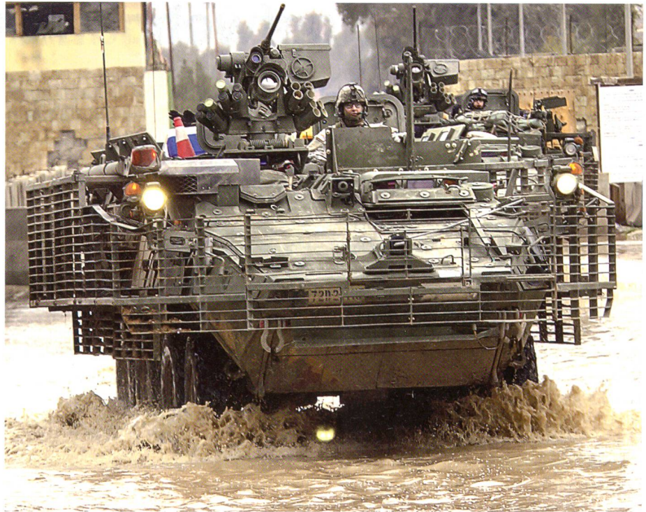
Ein Teil der von der amerikanischen Army im Irak eingesetzten Piranhas ist mit zusätzlichen Schutzvorrichtungen versehen. Sie machen die Fahrzeuge in bewohnten Gebieten unbeweglicher und schwerfällig.

Das geschützte Fahrzeug ist rundherum mit Sensoren ausgestattet. Sie erfassen und erkennen das anfliegende Geschoss in neun Metern Entfernung und lösen den Abwehrmechanismus aus. Das Abwehrsystem ist in der Lage, gleichzeitig mehrere Ziele zu bekämpfen. Die Zerstörung des Geschosses