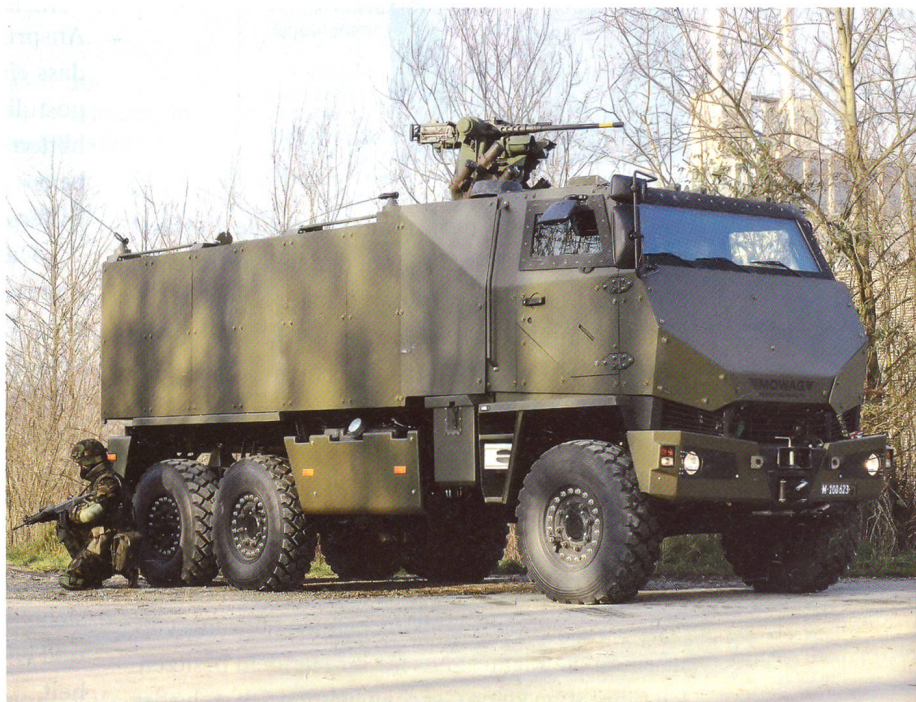
Der Duro IIIP, das neue Mannschaftstransportfahrzeug.

Auf befestigten Strassen sowie in überbautem Gebiet bewegen sich Radschützenpanzer bei Raumsicherungsoperationen rascher und flexibler als die teuren Kettenfahrzeuge. Die für die Raumsicherung geforderte Geländegängigkeit wird mit dem Geschützten Mannschaftstransportfahrzeug GMTF abgedeckt. Er bietet im Vergleich zum Schützenpanzer M 113 einen besseren Schutz gegen Minen und Spreng- und Brandvorrichtungen.