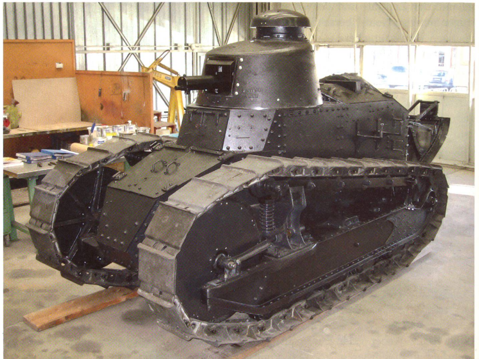
So präsentiert sich der noch motorlose «Renault FT 17».

2006 zeigte sich, dass die vielen Jahre im Freien dem Fahrzeug arg zugesetzt hatten. Als damaliger Kommandant des Lehrverbandes Panzer ordnete ich an, den Panzer in der Werkstatt komplett zu zerlegen. Bei diesen und weiteren Arbeiten zeigte sich: