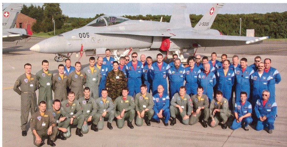
Schweizer Kommando beim Jagdgeschwader 71 «Richthofen» in Wittmund.