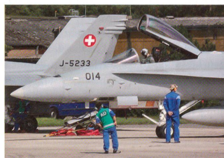
Schweizer Techniker überwachen das Anlassen der Triebwerke am Boden.