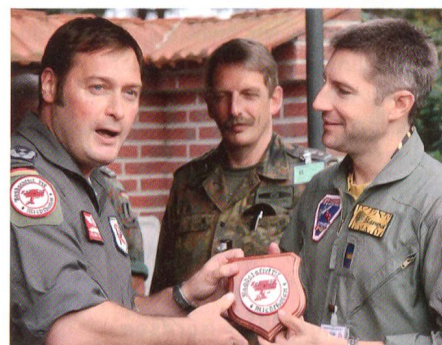
Der Staffelkapitän der 2. Jagdstaffel überreicht dem Schweizer Kommandoführer das Staffelwappen.