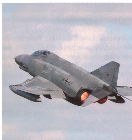
Startende F-4F Phantom des JG 71 «R».