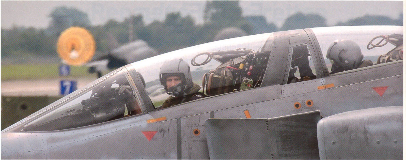
Zwei-Mann-Cockpit – Pilot und Waffensystemoffizier einer F-4F Phantom des Jagdgeschwaders 71 «R» aus Wittmund.