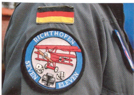
Staffelwappen der 1. Staffel des Jagdgeschwaders 71 «Richthofen».