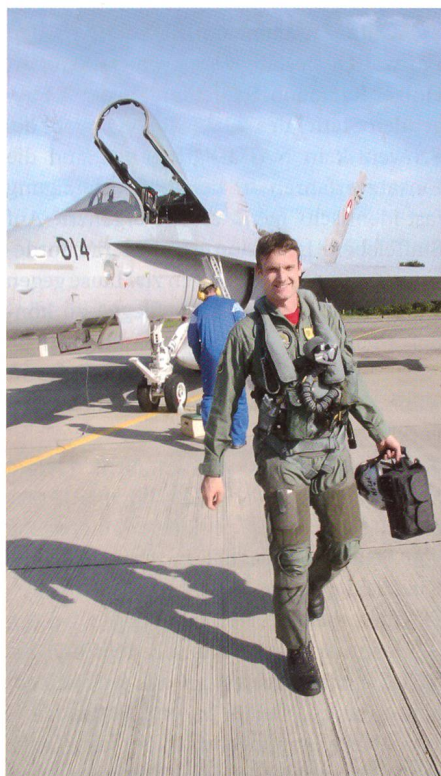
Schweizer Hornet-Pilot nach einem Trainingseinsatz.