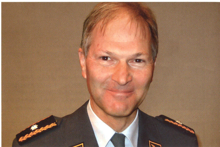
Brigadier Lätsch: «Wir müssen an den nächsten Krieg denken, nicht an den letzten.»

Nahtlos knüpfte Professor Rudolf Jaun, Dozent für Militärgeschichte an der MILAK, an Lätschs Gedanken an: «Nicht mehr die geballte Zerstörungskraft massierter Truppenverbände – oder von Massenvernichtungswaffen –, sondern der differenzierte Einsatz gesteigerter Feuerkraft steht im Vordergrund. Gleichzeitig ist der vermehrte Einsatz von Waffengewalt durch nichtstaatliche Akteure mit billigen Low-