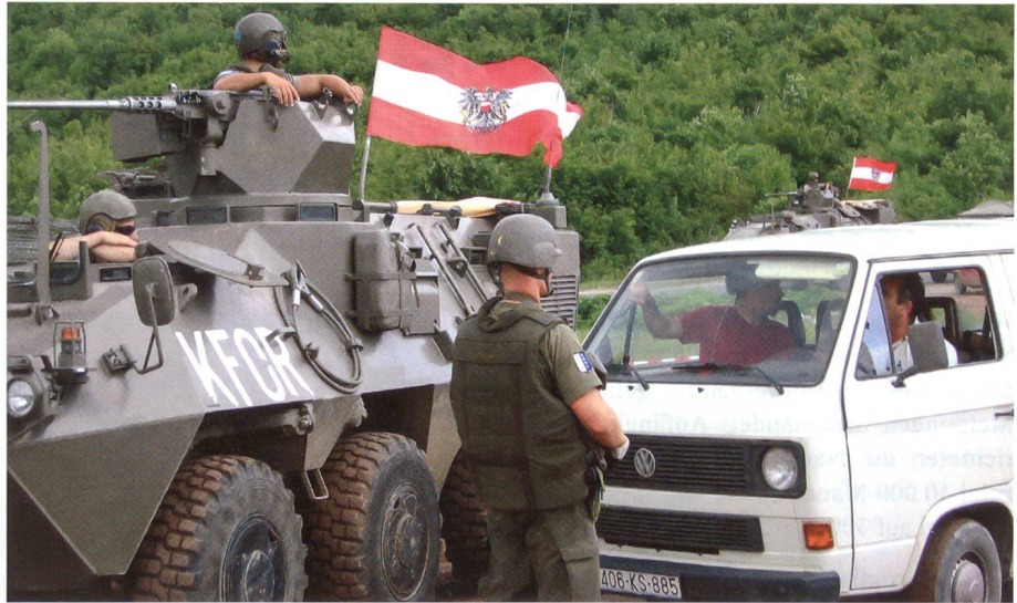
Nicht mehr Massenschlachten, sondern gezielte Einsätze: Österreichische Strassen-sperre und Verkehrskontrolle im Kosovo.

Zum Schluss trug Jaun kontroverse Thesen vor: «Die Aufrechterhaltung einer Grundfähigkeit zur Landesverteidigung dürfte in Konkurrenz stehen zu einer kooperationsfähig machenden Spezialisierung. Das Milizarmee-Format heisst: nicht-stehende Streitkraft. Dies verträgt sich suboptimal mit kooperativem Vorgehen und mit der schnellen Verfügbarkeit. Das vielleicht grösste Spannungsfeld besteht zwi-