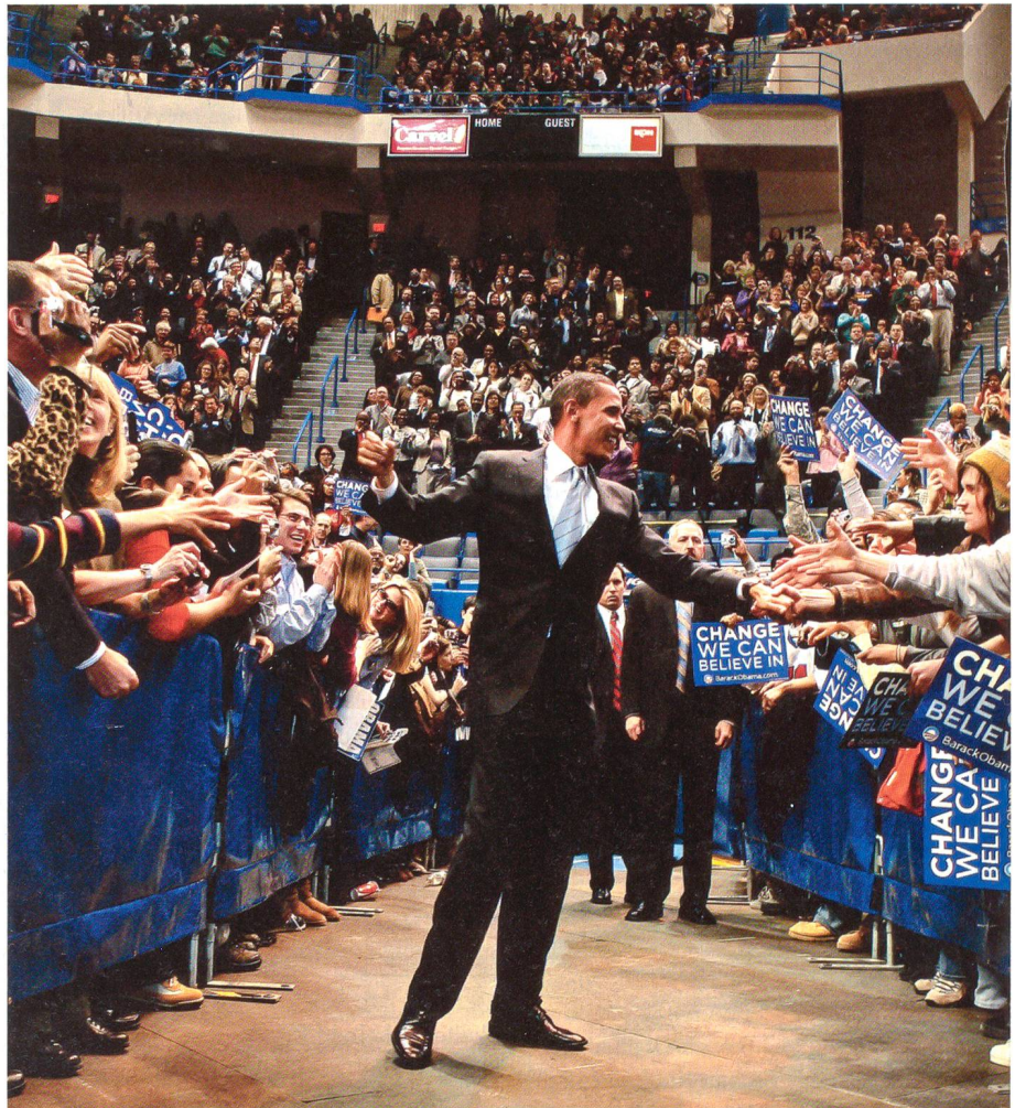
Barack Obama wird von seinen Anhängern gefeiert.