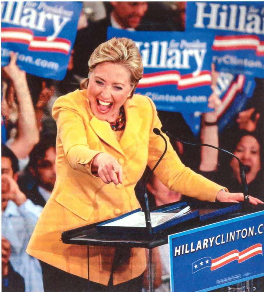
Hillary Clinton bei einer Wahlveranstaltung.

Es folgt ein Hinweis auf alte und neue Konkurrenten der Supermacht USA: Die