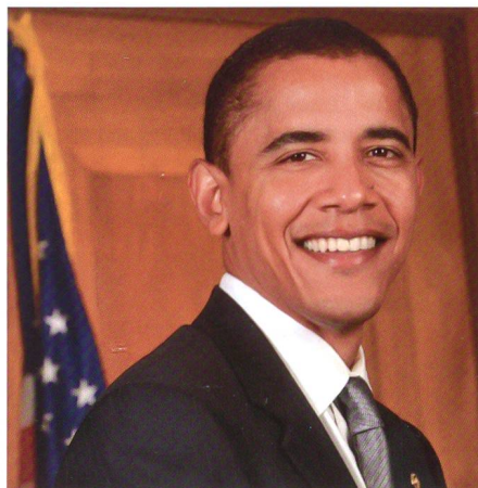
Barack Obama, der Senator des Bundesstaates Illinois, kämpft mit Hillary Clinton, der Senatorin von New York, um die demokratische Nomination für die amerikanische Präsidentschaftswahl vom 4. November 2008. Die Ernennung erfolgt an der Parteiversammlung der Demokraten vom 25. bis zum 28. August 2008 in Denver.

Michelle, meine Frau, ist die Liebe meines Lebens, sie ist die Mutter meiner Kinder.