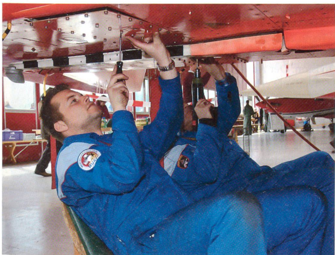
Flugzeugmechaniker sorgen für die Wartung.