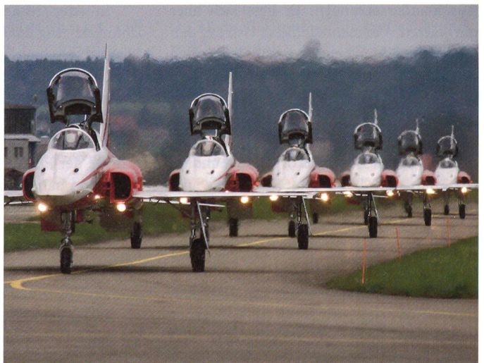
Perfektion in Reih und Glied auch auf dem Boden.