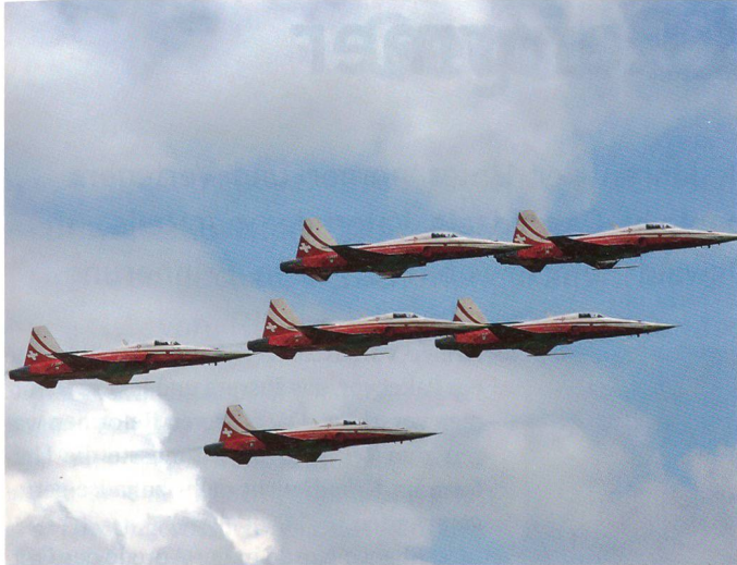
Die Patrouille Suisse bei der Vorführung in Emmen.