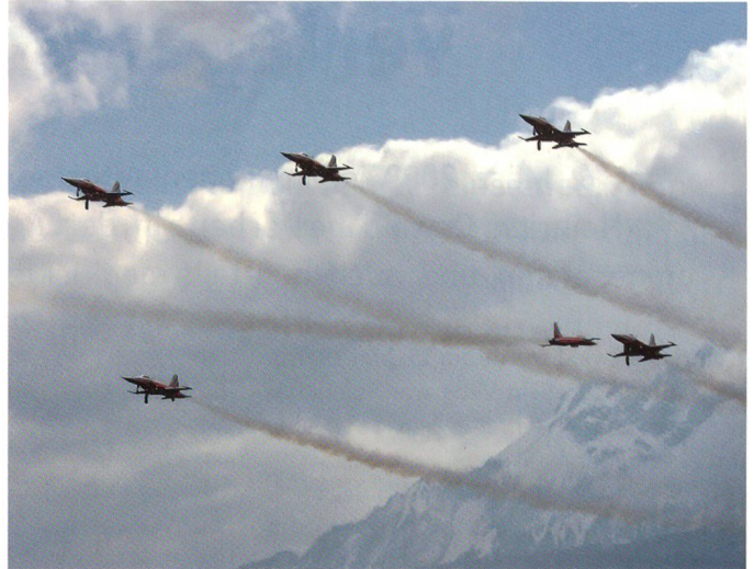
Die neue Figur «Goal» zu Ehren der EURO 08.