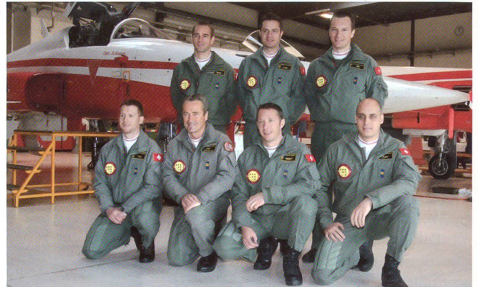
Das Team der Patrouille Suisse für das Jahr 2008.