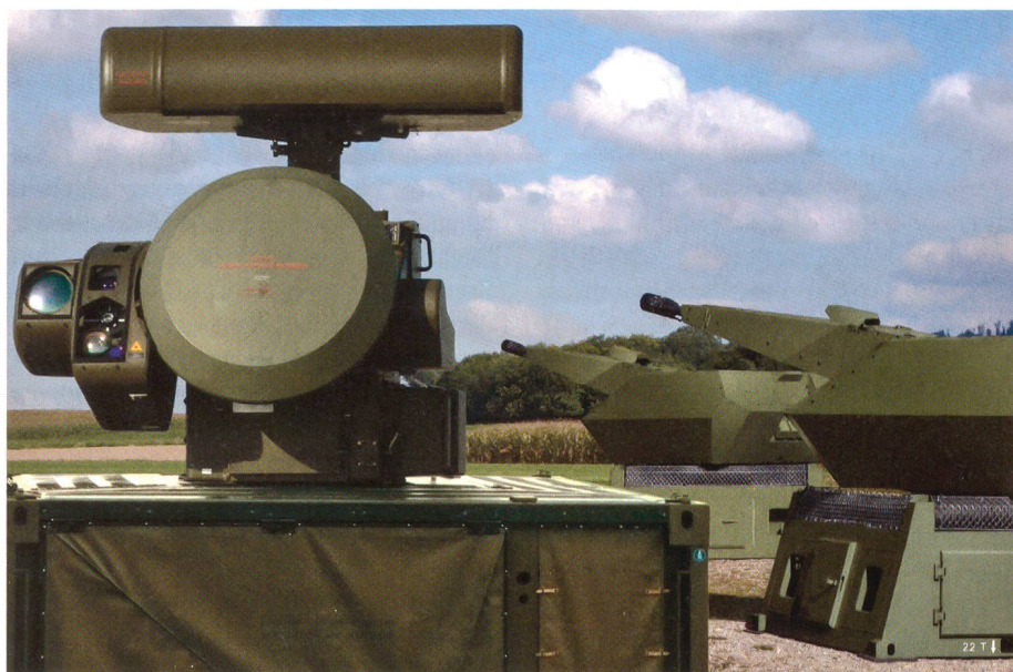
Oerlikon Contraves muss Rüstungsgüter weiterhin exportieren dürfen.

Würde das Schweizervolk den GSoA-Vorstoss annehmen, dann gerieten Schweizer Wehrfirmen wie die RUAG, die MO-WAG, die Pilatus-Werke und Oerlikon Con-