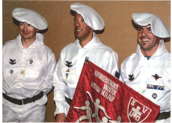
Paracadutisti Milano mit Preis (mit Beret, nicht Pizza).