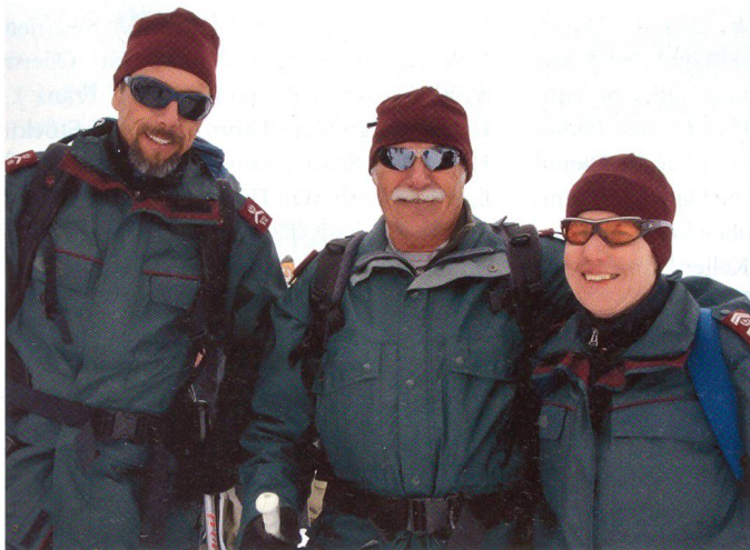
Patrouille der Grenzwaache.