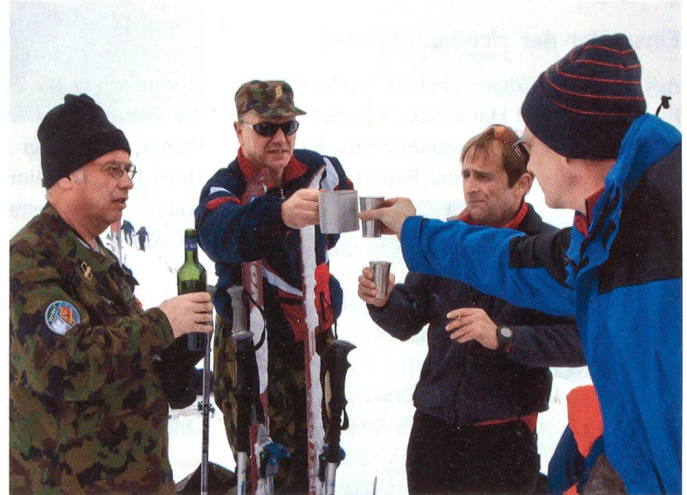
Auf dem höchsten Punkt, auf dem Rinderberg.