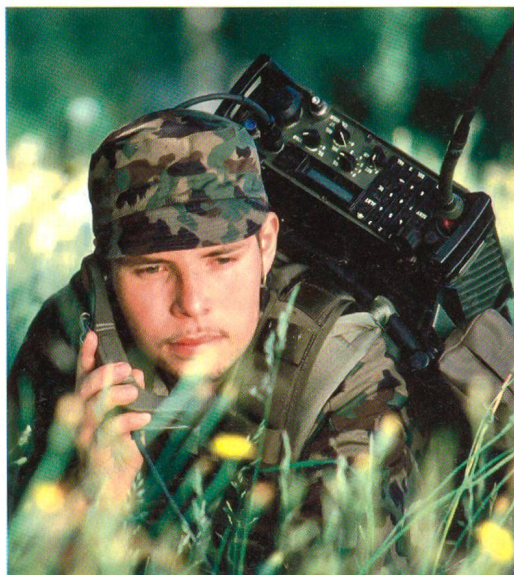
Rund um die Uhr bereit.

Tag der Bevölkerung, 09.00 – 18.00 Uhr: Öffentliche Vorführungen und Präsentationen