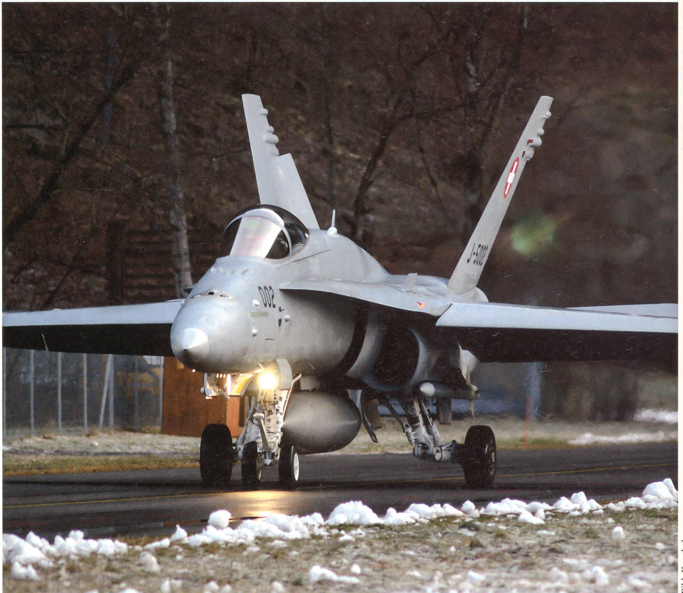
Die zweite Teilstreitkraft der Schweizer Armee ist die Luftwaffe. Hier ein F/A-18 in Meiringen.

Das heisst, nicht nur Kommandostruktur, aber auch die Kontrolle der Mittel und die Kommunikationsinfrastruktur sind in einer einzigen Hand und es gibt keine Elemente wo ein unabhängiges Management