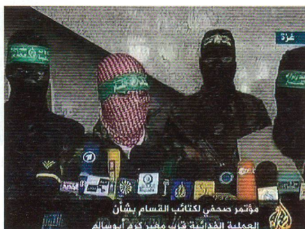
Hamas-Sprecher Obeida am Fernsehen.