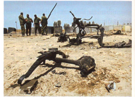
Was vom Sprengstoff-Jeep übrig blieb.