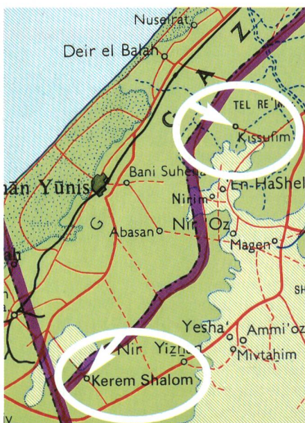
Kerem Shalom und Kissufim.