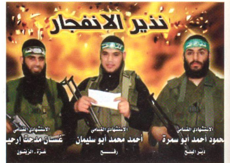
Drei Suizid-Attentäter vor der Tat.

rem Shalom mit Mörser- und Raketenfeuer. Im Schutz der Minenwerfer rasten zwei Jeeps auf den israelischen Wachturm und einen israelischen Stützpunkt zu. Doch gelang es den israelischen Verteidigern, die beiden Fahrzeuge in die Luft zu jagen, bevor diese ihre Ziele erreichten. Die Jeep-Fahrer kamen um, auf israelischer Seite wurde niemand verletzt.