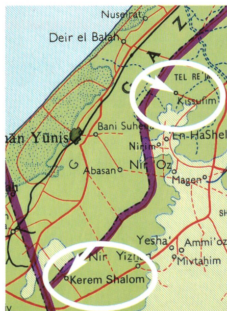
Kerem Shalom und Kissufim.

rem Shalom mit Mörser- und Raketenfeuer. Im Schutz der Minenwerfer rasten zwei Jeeps auf den israelischen Wachturm und einen israelischen Stützpunkt zu. Doch gelang es den israelischen Verteidigern, die beiden Fahrzeuge in die Luft zu jagen, bevor diese ihre Ziele erreichten. Die Jeep-Fahrer kamen um, auf israelischer Seite wurde niemand verletzt.