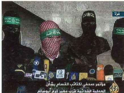
Hamas-Sprecher Obeida am Fernsehen.