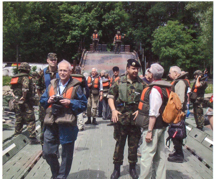
Belastungsprobe der Schwimmbrücke durch EMPA-Mitglieder.