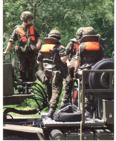
Teamarbeit beim Einwassern.