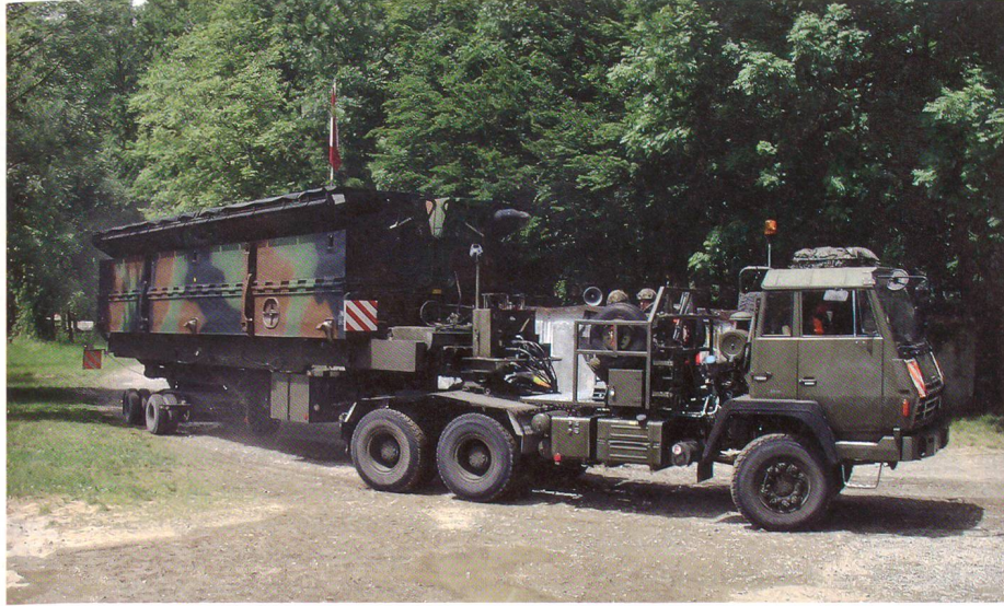
Steyr-Lastwagen fahren mit Brückenelementen vor.