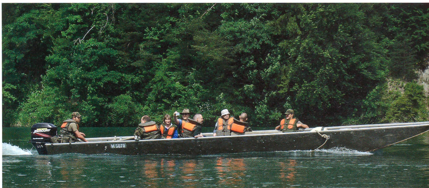
Die EMPA unterwegs auf der Aare.