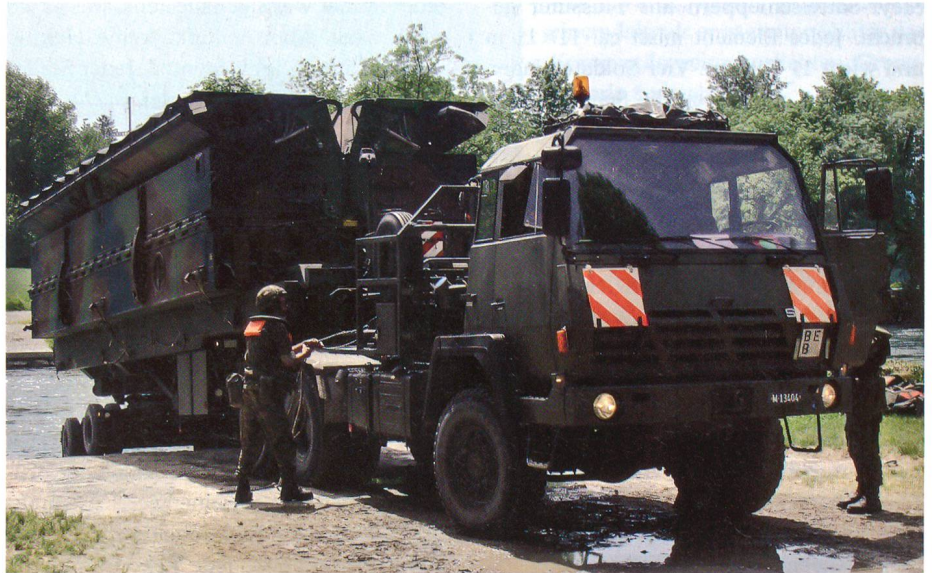
Das erste Element der Schwimmbrücke wird in die Aare gelassen.