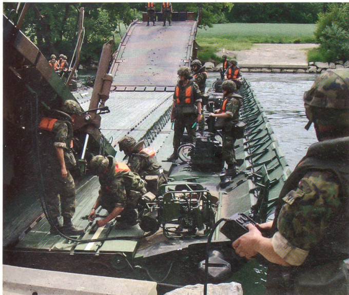
Ein heikles Manöver: Die Rampe wird montiert.