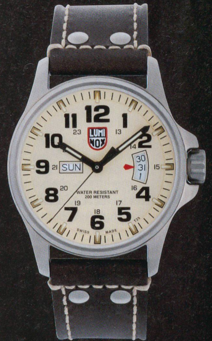
Field Time Date - 1827 Ø 42 mm CHF 490.- (UVP)

Ultimatives stromunabhängiges Beleuchtungssystem. 100 x länger und heller als herkömmliche Leuchtuhren, garantiert während 25 Jahren. Zu den Trägern gehören; FBI, CIA, U.S. Navy SEALs und Air Force.