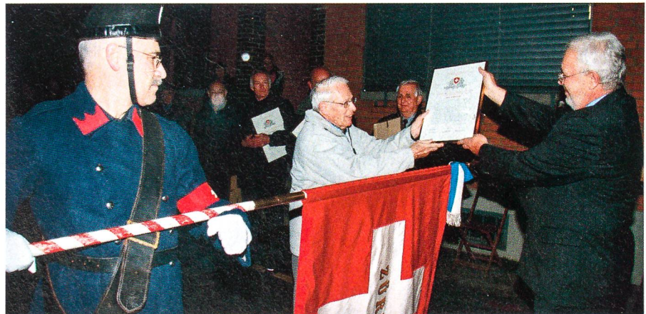
Der Übergabe der Dankesurkunden an die ehemaligen Kader des P-26 im Zürcher Oberland gab die Ehrenformation der Compagnie 1861 einen würdigen Rahmen.

Am 7. September 2009 war es soweit: Bundesrat Ueli Maurer sprach im Ständerat den Angehörigen der Widerstandsorganisationen seit 1940 seinen Dank und Anerkennung für den geleisteten Dienst aus und entband sie von der Geheimhaltung in Bezug auf ihre persönlichen Erlebnisse. ah.