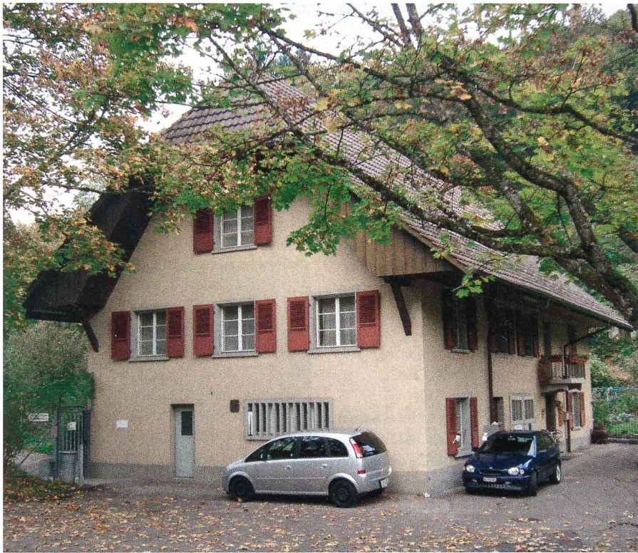
Der «berühmte» KP der P-26 in Oberburg, damals enttarnt durch einen Journalisten.