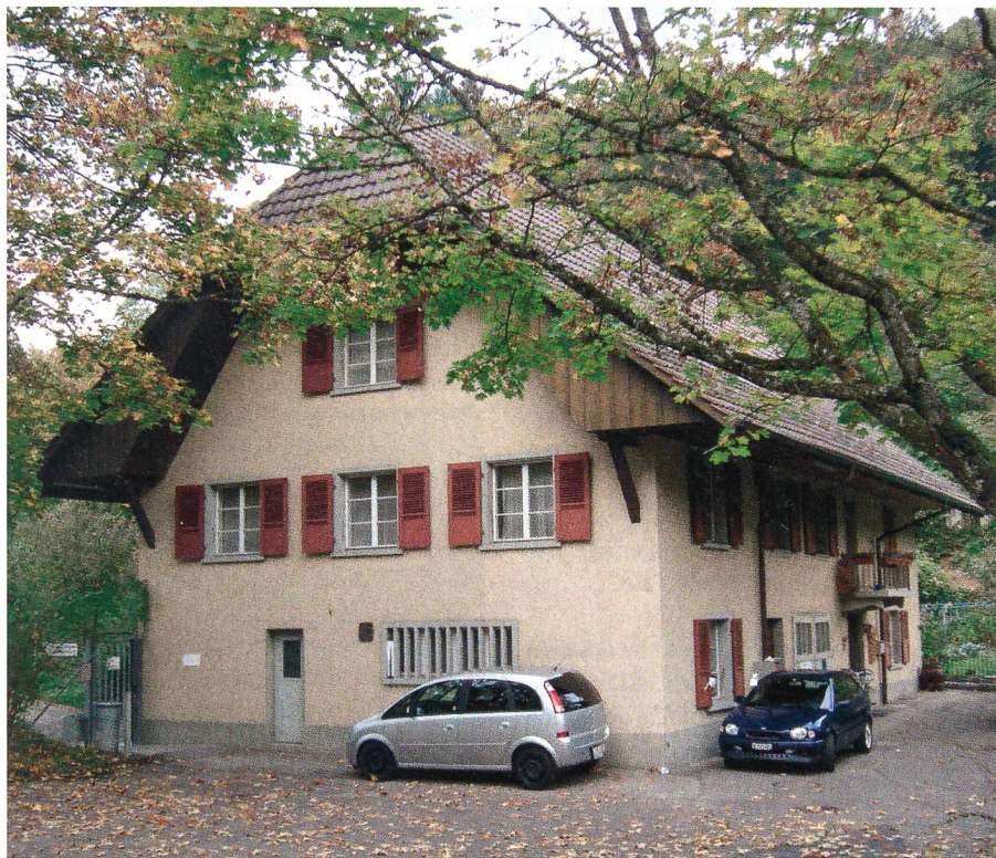
Der «berühmte» KP der P-26 in Oberburg, damals enttarnt durch einen Journalisten.