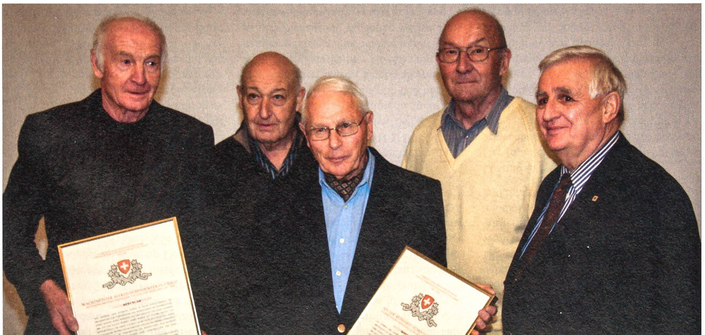
Das Zürcher Oberland war bereit: Vier ehemalige Kader der Widerstandsregion 79 A und der Geniechef der Reserve-Widerstandsregion 79 B nach der Verdankung.

Das Dienstverhältnis eines Feldmitgliedes von P-26 basiert auf einem Vertrag mit dem EMD, gegengezeichnet vom jeweiligen Ge-