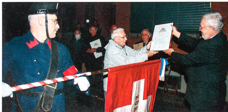
Der Übergabe der Dankesurkunden an die ehemaligen Kader des P-26 im Zürcher Oberland gab die Ehrenformation der Compagnie 1861 einen würdigen Rahmen.

Am 7. September 2009 war es soweit: Bundesrat Ueli Maurer sprach im Ständerat den Angehörigen der Widerstandsorganisationen seit 1940 seinen Dank und Anerkennung für den geleisteten Dienst aus und entband sie von der Geheimhaltung in Bezug auf ihre persönlichen Erlebnisse. ah.