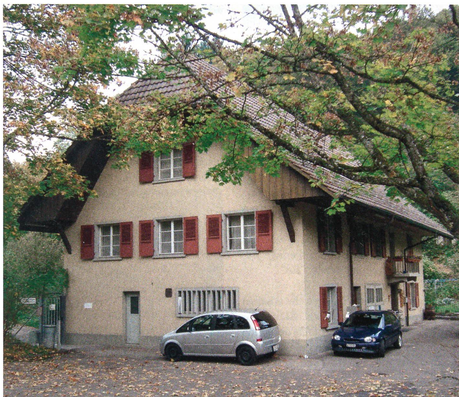
Der «berühmte» KP der P-26 in Oberburg, damals enttarnt durch einen Journalisten.