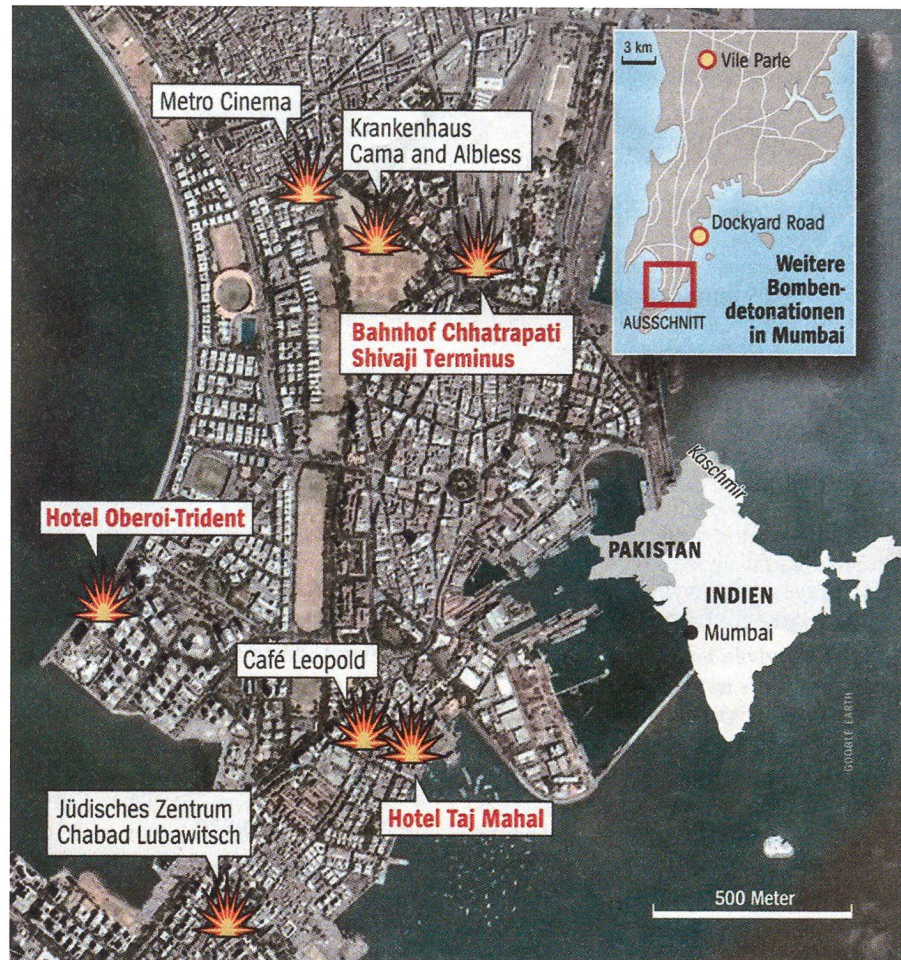
Die Terroristen griffen sieben Ziele an. Die Stadt Bombay ist nach drei Seiten offen.

In der Nacht zum 27. November 2008 gibt ein im Hotel Oberoi verschanzter Terrorist dem indischen Fernsehsender India Television ein Telefoninterview. Alle in Indien inhaftierten Islamisten mussten sofort freigelassen werden. «Ihr habt uns Unrecht