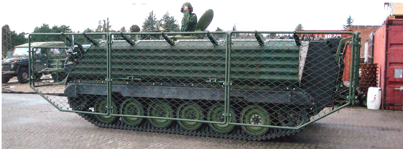
Gut sichtbar sind die am Schützenpanzer M-113 angebrachten Drahtgitter, welche einen guten Schutz gegen den Beschuss mit Panzerabwehrwaffen bieten.

Firma, womit die Kapazität in Forschung, Entwicklung und Testen von Schutzprodukten wesentlich verstärkt wird.