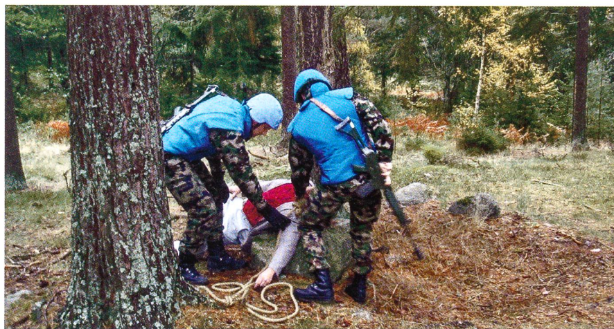
Realistische Aktion im lockeren Schwedenwald.

Der grösste Teil der Ausbildung fand draussen statt, ein grosses Plus dieser Ausbildung. Zu Beginn der ersten Ausbildungswoche gab es eine zweitägige theoretische