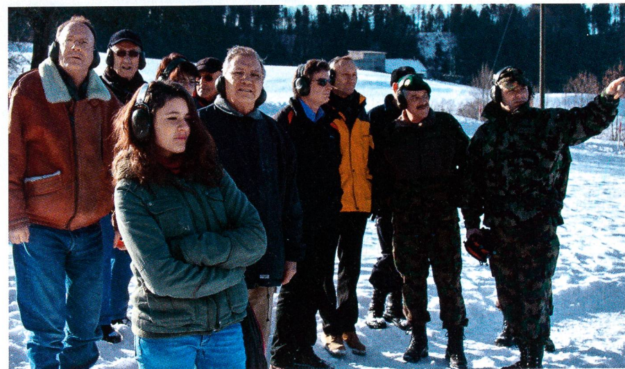
Die illustre Gästeschar verfolgt aufmerksam das Wettkampfgeschehen.