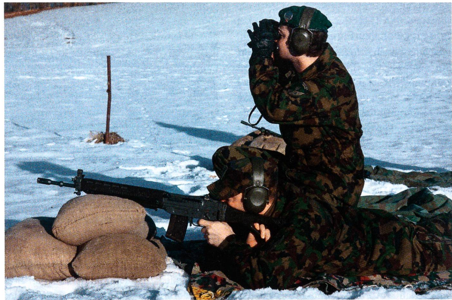
Anspruchsvoller Schiesswettkampf: Total acht Treffer auf Zeit.