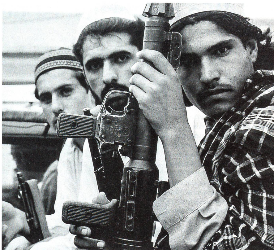
Ein junger Taliban-Kämpfer mit der Panzerfaust RPG-7 in Afghanistan.

Regli nannte dafür die aus seiner Sicht absolut untragbare Veröffentlichung von Fotos in der Zeitschrift Paris Match mit einem Taliban-Kommandanten in einer Uniform eines kurz zuvor brutal getöteten französischen Soldaten in Afghanistan im letzten Jahr. Weiter erwähnte er die letztjährige Rede des türkischen Ministerpräsidenten Erdogan vor Landsleuten in einem Stadion