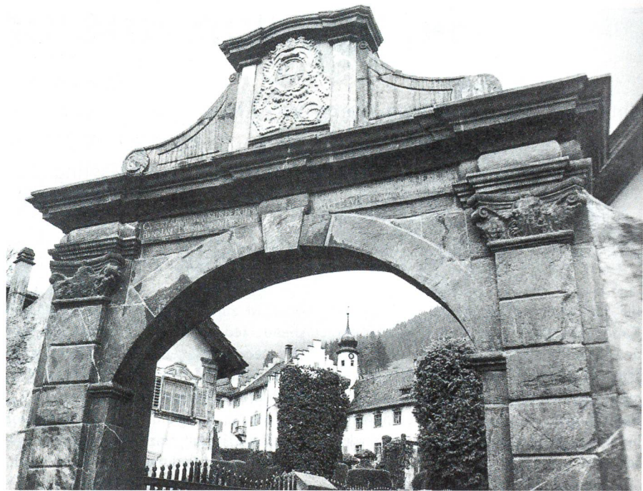
Torbogen zur palastartigen Schlossanlage des Bothmar.

Dieser griff auch innerhalb der Truppe durch, so hart wie es gerade der durchgeis-