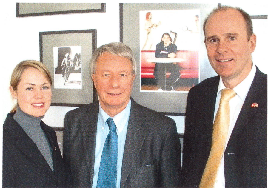
Besuch in Washington: Nationalrätin Natalie Rickli, Botschafter Urs Ziswiler und Nationalrat Thomas Hurter.

Die in der Schweiz bezahlten Steuern liegen im Übrigen einiges über dem Durchschnitt der OECD-Staaten. Wir haben auch dargelegt, dass das schweizerische Steuersystem auf dem Grundsatz der Selbstdeklaration basiert. Dem Bankgeheimnis liegt der Schutz der Privatsphäre des Individuums zugrunde, weshalb es korrekt eigentlich Bankkundengeheimnis heisst. Das forsche Vorgehen des US-Justizdepartements wurde teilweise auch auf amerikanischer Seite als