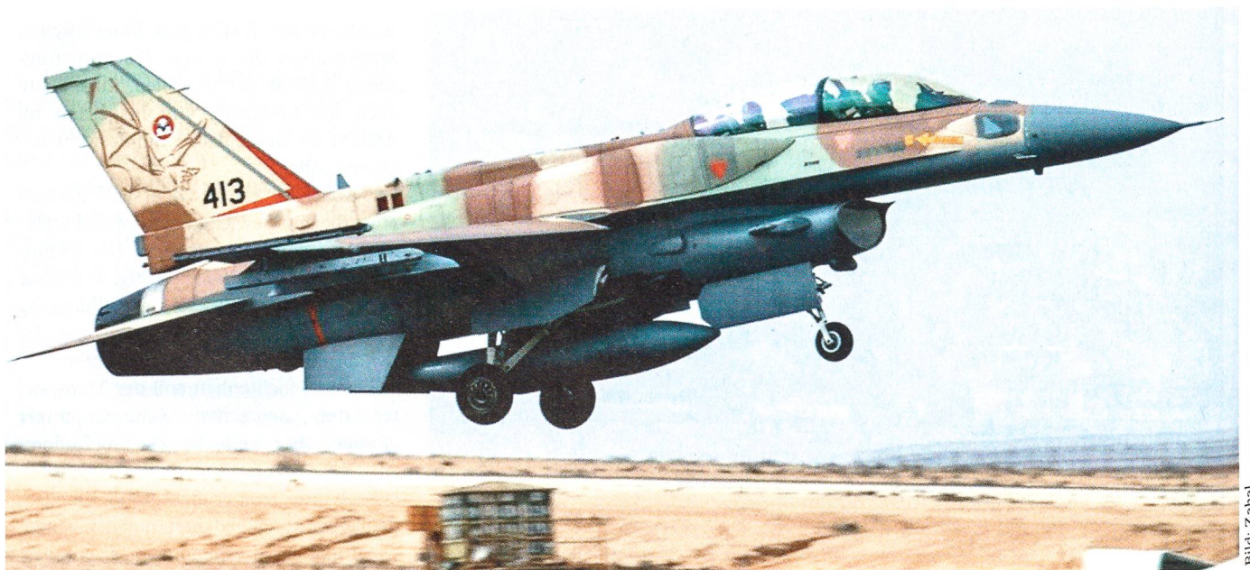
Ramon, ein grosser israelischer Luftstützpunkt, liegt im Negev: Ein F-16 hebt von Ramon aus ab, gut mit Raketen bestückt.