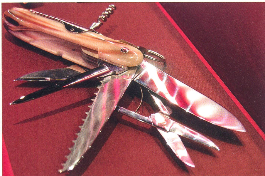
Ein besonders schönes Exemplar.

Zum weltweiten Erfolg und Imageträger für «Swissness» haben dann insbesondere die amerikanischen GI's beigetragen, welche nach dem Zweiten Weltkrieg das Taschenmesser als Andenken oder als Werk-