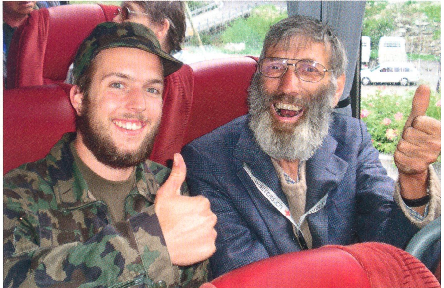
«Freude bereiten»: Glückliche Gesichter auf der Rückfahrt von der Bettmeralp.

Leider war uns Petrus dieses Jahr nicht so hold, sodass einige der Ausflüge nicht bei idealer Witterung durchgeführt werden konnten. Die eigens für das AIB eingerich-