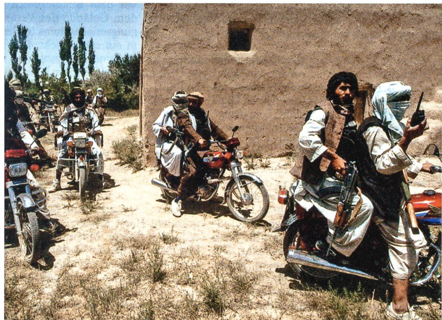
Taliban auf Motorrädern: Wird der Bauer erst zum Gegner, wenn er eine Waffe trägt?