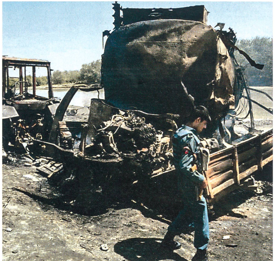
4. September 2009: Einer der beiden zerstörten Tanklastwagen bei Kunduz.

Gegen 21 Uhr erhält in Kunduz der J2, der Nachrichtenoffizier, die Meldung vom Überfall. Sofort unterrichtet er Oberst Klein. Für den Kommandanten des Feldlagers ist «höchste Gefahr in Verzug»: Die