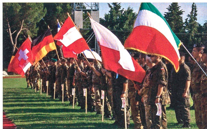
Impressionen des AESOR-Wettkampfs vom 26. und 27. Juli 2009 aus dem italienischen Viterbo.