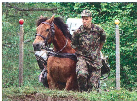
Pferd und Wehrmann.

Bei unerwartet schönem Wetter haben die diesjährigen Pferdesport- und Traintage der Armee stattgefunden. Nebst den herkömmlichen Prüfungen wie Dressur, Springen