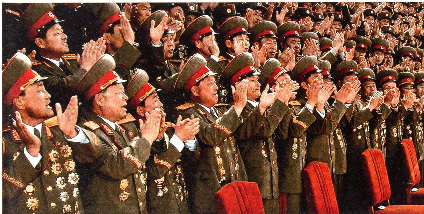
«Demokratie» à la Nordkorea: Dutzende hochrangiger Offiziere in gut orchestriertem Jubel.

Es gibt kein besseres ökonomisches Rezept für ein Land, aus der Armut zu kommen, als eigene Stärken im Weltmarkt einzusetzen. Das Land muss jenes Gut anbieten, das es am besten anbieten kann. Selbst wenn andere Länder bessere Anbieter von billiger Arbeit sind, kann Nordkorea nichts