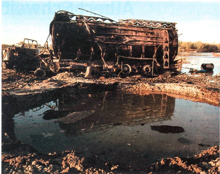
4. September 2009, bei Kunduz: Ausgebrannter Tanklastzug nach NATO-Luftangriff.

Niemand wolle, dass sich Iran Nuklearwaffen zulege, meinte auch der russische Wissenschaftler Alexei Arbatow. Nur sei es schwierig, eine gemeinsame Front aufzubauen. So sei es fraglich, ob Russland und