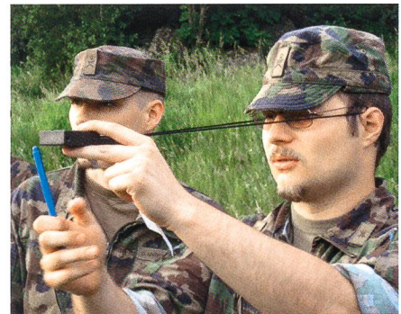
Mit Feuer und Flamme: Guter Einsatz vor der Beförderung