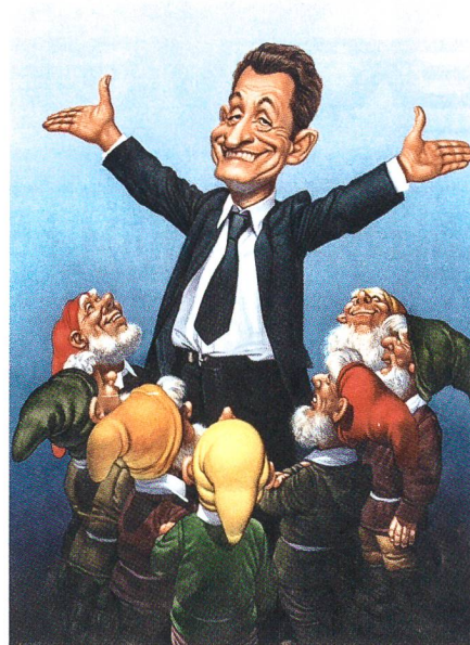
Von Frankreich lernen: Wie man der Grösste wird, wenn man sich mit den richtigen Partnern umgibt.

Wie staunt die Kompanie, als ein Dutzend Faulpelze vortreten. Für Spott brauchen sie nicht zu sorgen, und der Küchenchef freut sich auf etliche Hilfskräfte zum Kartoffelspitzen.