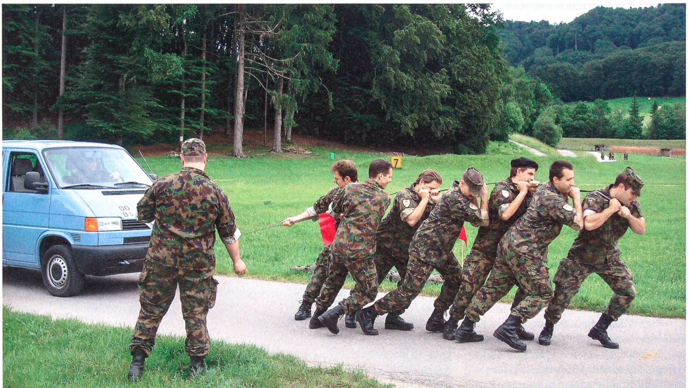
Sie ziehen am gleichen Strick – und das schwere Fahrzeug.

Wiederum Entschlussfassungsübung bei Posten 7. Rund um Bern tobt der Krieg. Der Zugführer ist gefallen. Der Postenchef gibt die militärische Lage bekannt, die Bestände an AdA und an Material sowie eine ausführliche Information über die feindliche Absicht. Ein Lageplan ist vorhanden, die Anzahl Gegner ist unbekannt. Auftrag: Die feindliche Artilleriestellung ist zu vernichten, der Bereitschaftsraum ist zu si-